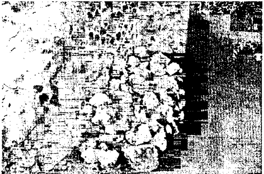
Fig. 5 - Cumulo di pietre di gesso nel giardino della casa del Sacello Iliaco.