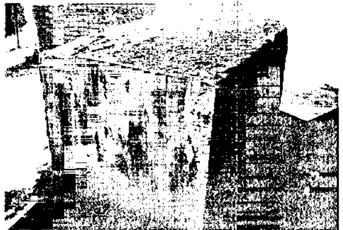
Fig. 2 - Blocco in pietra tagliato con sega a due maniche (Cantiere del Tempio di Venere).

Dopo la sbazzatura il blocco veniva rifinito dai lapidarii con scalpelli di forma diversa: nel