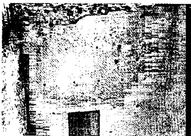
Fig. 8 - Opus quasi reticulatum .

nell'ultima fase edilizia di Pompei, quando la città era stata trasformata in un enorme cantiere per il restauro dei danni provocati dal sisma del 62 d.C. è testimoniato dalla presenza di un forno di cottura provvisorio installato nella Casa del Sacello Iliaco (Fig.4). In questa casa, inoltre, è stato rinvenuto nel centro di un cumulo di pozzolana la calce che era in procinto di essere impastata al momento dell'eruzione oltre ad alcuni blocchi di pietra di gesso (Fig. 5). Altri cumuli di calce si possono notare nel corridoio d'ingresso della Casa del Moralista dove probabilmente erano in corso lavori di manutenzione. Nella Casa del Moralista è possibile, inoltre, osservare alcuni tramezzi realizzati in opus craticium che rappresen-