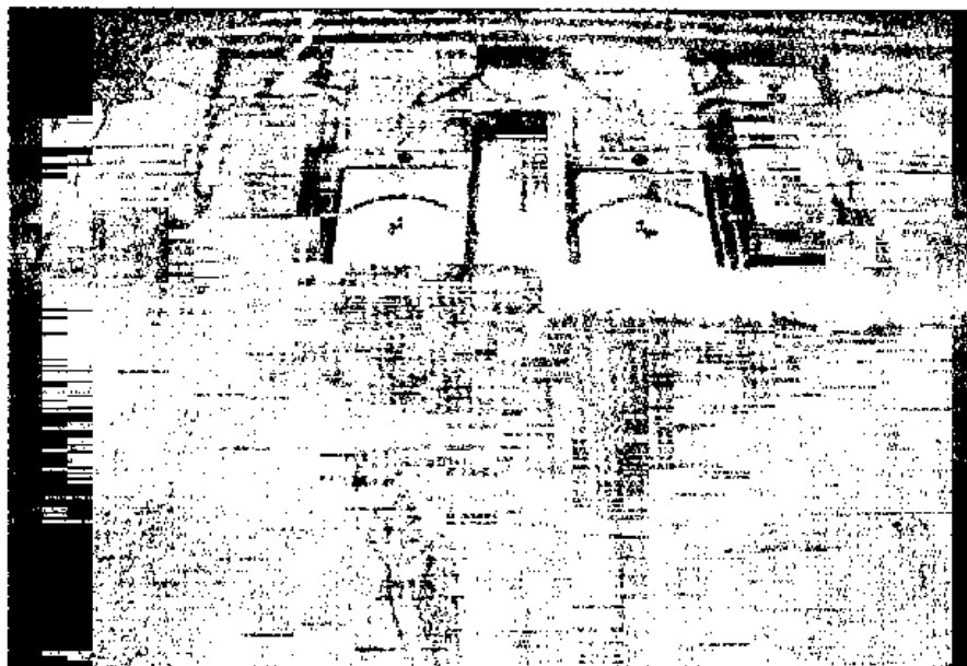
Fig. 14 - Decorazione incompleta di una parete della casa del Sacello Iliaco.

Innumerevoli sono gli esempi di opus mixtum che si possono, quindi, ritrovare a Pompei. Un interessante esempio è quello relativo alla Porta Ercolano nota anche come la "Porta del Sale" (Porta Saliniensis) attraverso la quale veniva trasportato il sale proveniente da Ercolano ed estesamente impiegato a Pompei per la preparazione del garum, una salsa di pesce marinato il cui uso nella cucina romana è paragonabile a quello della salsa di pomodoro nella cucina mediterranea. La porta è realizzata con catene angolari in mattoni e pietre completate con un paramento in opera incerta e ricoperta da un rivestimento in stucco bianco. Questo tipo di rivestimento - che imitava l'opera quadrata - fu impiegato estesamente a Pompei, unitamente agli intonaci per la decorazione e la protezione delle strutture. Balza immediatamente agli occhi - percorrendo le strade di Pompei - che lo spessore degli intonaci è di gran lunga maggiore di quello medio (2 cm) dell'edilizia attuale. Nonostante lo spessore elevato però, il numero degli strati raramente coincide con quello raccomandato da Vitruvio (7 strati): i rivestimenti pompeiani, infatti,