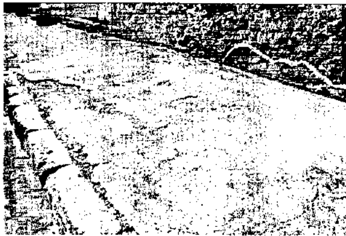
Fig. 1 - Marciapiedi in opus signinum (Via dell'Abbondanza).

Vi propongo, quindi, un itinerario che vuole essere alternativo rispetto a quelli classici riportati nelle guide più famose disponibili. Un itinerario, cioè, che non ha come obiettivo quello di analizzare ad esempio gli stili della pittura pompeiana, o la struttura delle domus romane o ancora l'arredo in bronzo ed il vasellame pregiato della Casa di Giulio Polibio . Il percorso che vi suggerisco - e che potreste seguire su una delle mappe disponibili per Pompei - invece, è finalizzato all'esame dei materiali e delle tecniche costruttive utilizzate dai Romani. L'itinerario suggerito inizia da Porta Marina , uno dei principali accessi alla città che collega l'estremo ovest del decumanus maximus - costituito dalla via omonima e da Via dell'Abbondanza - con la Porta di Sarno all'estremo est della cinta muraria di Pompei. Lungo la Via Marina è possibile ammirare alcuni marciapiedi in opus signinum, con il rivestimento costituito da una malta di calce (nucleus) in cui sono disseminati grossi frammenti ceramici e tessere di marmo di colore bianco (crustae) in esso inglobati mediante battitura, con una tecnica antesignana di quella