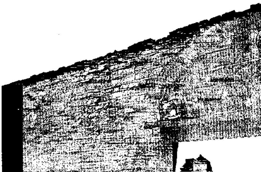
Fig. 11 - Opus mixtum.