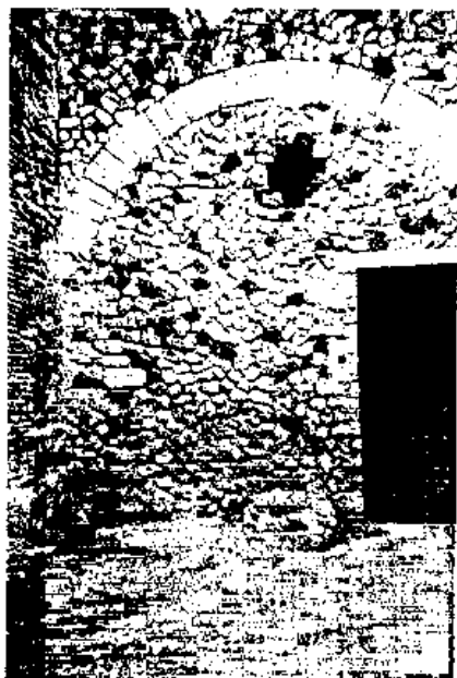
Fig. 7 - Opus incertum . Ingresso della Casa del Criptoportico.

Nelle Terme Centrali, inoltre, si può rilevare la classica struttura tripartita della muratura, comune alla maggior parte degli edifici pompeiani, costituita da solidi paramenti laterali rivestiti da spessi strati di intonaco di elevata resistenza meccanica, che fungono da "armature" di confinamento per il nucleo di scadente fattura realizzato con pietrame e malta terrosa in cui si notano dispersi alcuni granuli di calce (Fig. 3).