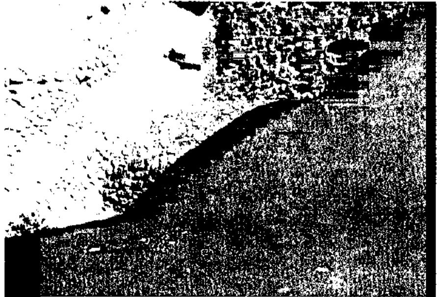
Fig. 4 - Forno Provvisorio per la cottura della calce nel giardino della casa del Sacello Iliaco.

Si possono ammirare, infatti, quattro capitelli dorici: il primo dei quali appena sbizzato mediante punteruolo e martellina; si passa poi a due blocchi intermedi in cui si comincia ad intravedere la forma del capitello e si nota la lavorazione effettuata con lo scalpello dritto e con la gradina; il quarto blocco, invece, è completamente lavorato con le foglie di acanto ben definite e levigate. Altrettanto interessante è l'esame dei sistemi con cui i blocchi di pietra venivano ancorati ai mezzi di sollevamento. Nelle Terme Centrali si possono notare nello stibate del portico le sporgenze della pietra (ancones) alle quali venivano ancorate le funi e che venivano asportate dai quadratori al momento della finitura del blocco.