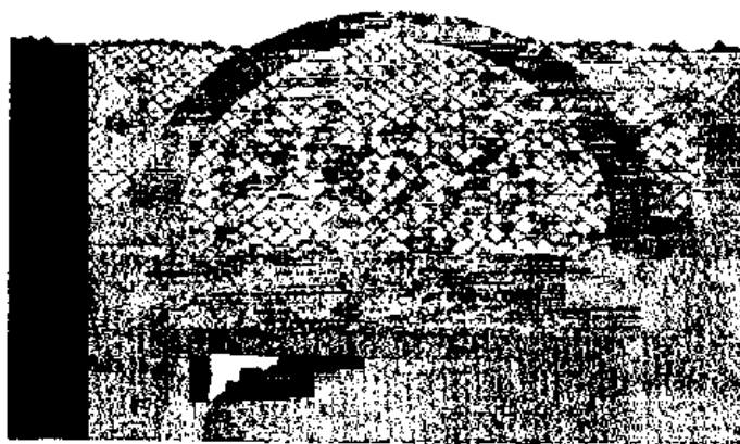
Fig. 9 - Opus reticulatum (Macellum).

del Fauno) conduce ad una sorta di "smitizzazione" del concetto di solidità dell'opus caementicium quale nucleo portante della muratura. Nella maggior parte degli edifici antecedenti all'età imperiale, infatti, i paramenti, realizzati prevalentemente in opus africanum - muri con catene verticali in pietra in cui si alternano blocchi verticali e orizzontali collegate da filari elementi lapidei di piccole dimensioni - erano riempiti con malta argillosa di scadente fattura in cui si notano dispersi i granuli di calce. Solo più tardi - negli edifici costruiti intorno alla metà del IV secolo a.C. si ritrovano murature con nuclei in opus caementicium realizzati con malte di calce di eccellente fattura. Un impiego più massiccio della calce