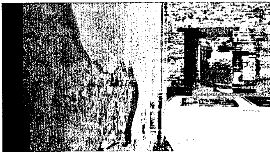
Fig. 12 - Particolare dell'intonaco della Casa della Venere in Conchiglia.