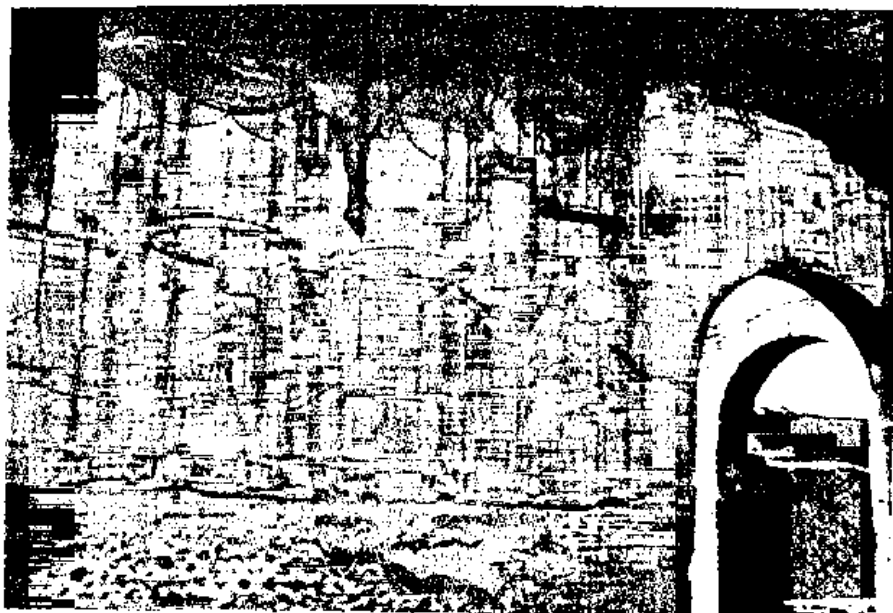
Fig. 16 - Parete decorata con stucchi (Terme Stabiane).

secondo peristilio, il rivestimento del paramento è costituito da grosse tegole rettangolari di ceramica (Fig. 13), che erano state private delle alette e fissate alla parete con malta e chiodi: una sorta di "sbarramento verticale" ante litteram.